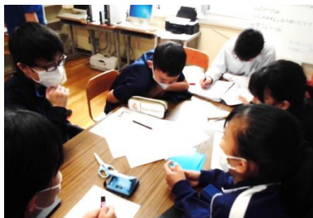
生徒会役員打合せ

午後は校庭にて生徒会企画となります。生徒や他の保護者の方との距離を取りながらの見学をお願いします。