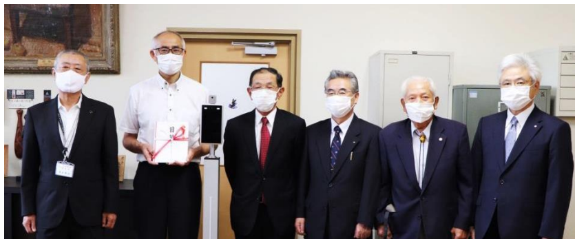
A I 体温測定器寄贈 富士見ロータリークラブの皆様より

過日 9 月 15 日、A I 体温測定器を富士見ロータリークラブ（原村の方も関わってくださっています）より寄贈いただきました。50 周年記念事業の一環ということですが、このコロナ禍学校では喉から手が出るほど必要なものです。有効に活用させていただきます。もみの木祭の来客者の皆様に使用させていただきます。